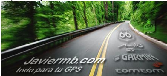
imagen logotipo con motivo del Día del Pilar.